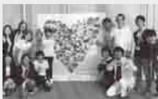
世界自閉症啓発デー 2016 in FUKUI