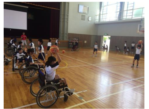
△車椅子バスケットボール体験