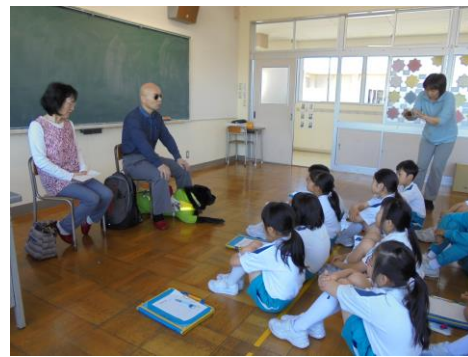
△視覚障がいのある方からのお話