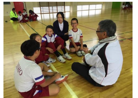
△まちづくり協議会の方と福祉体験のふりかえりを行う子どもたち