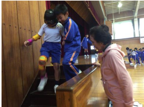
△福祉教育サポーターの活動