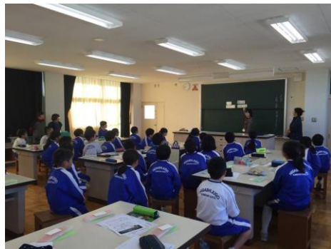
△点訳ボランティアさんによる指導