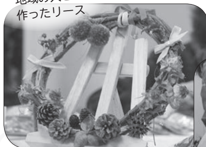
地域のひと 作ったリース

公園にある松ぼっくりやどんぐりを集めてボランティアと一緒に手作りリースキットを作っています。キットを使ったリース体験教室でも利用者と地域の方が一緒になってリース作りをすることで、たくさんのつながりを生むきっかけとなっています。