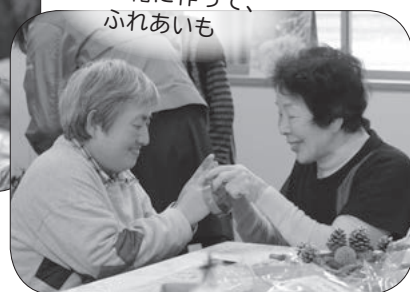
一緒に作って、 ふれあいま