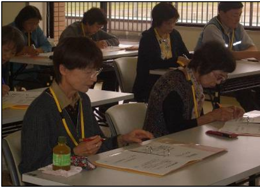
生活・介護支援ボランティア養成講座 講義

坂井市に登録し、定期的に高齢者宅に伺い、お話をしながら、利用者さんの体調等に変わりがないか確認したり、換気等の簡単な環境整備を行っています。活動前に、養成講座を受講しますので、安心して活動できます。また、ご自身の介護予防にも効果があるといわれています。