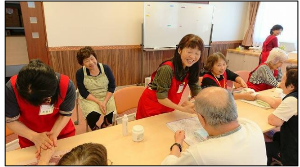
ビューティケアボランティア養成講座 実習

高齢者や入院中の方々にマッサージを行うことで、心を和らげ、日々の生活意欲を高めてもらうことを目的としたボランティア活動で、市内では、2つのグループ（水仙、ほっこり）が活動しています。