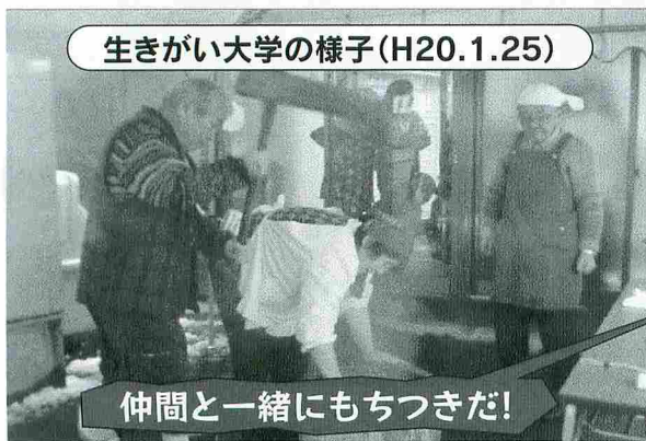
生きがい大学の様子(H20.1.25)