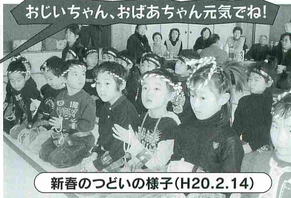
おじいちゃん、おばあちゃん元気でね!