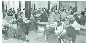
高齢者の生きがいがつくりサロンの実施