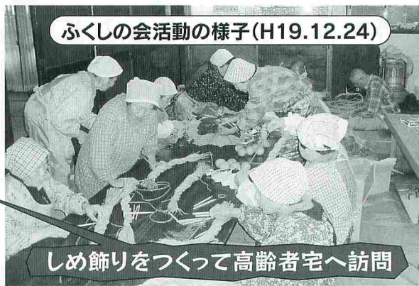
ふくしの会活動の様子(H19.12.24)