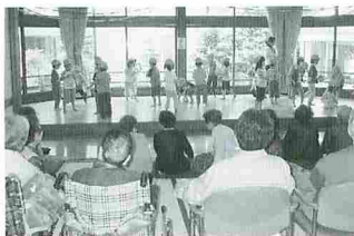
民間団体支援 ほか