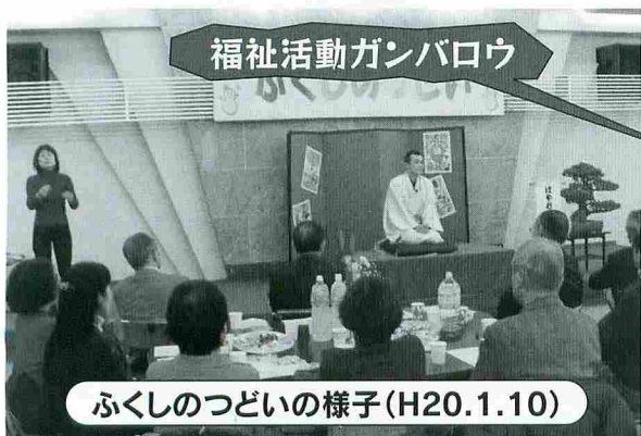
福祉活動ガンバロウ