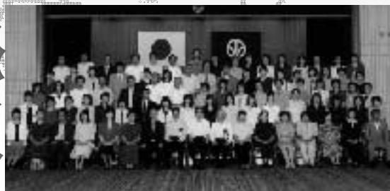
高齢者のみなさんと日本の福祉施策やボランティア活動について相談