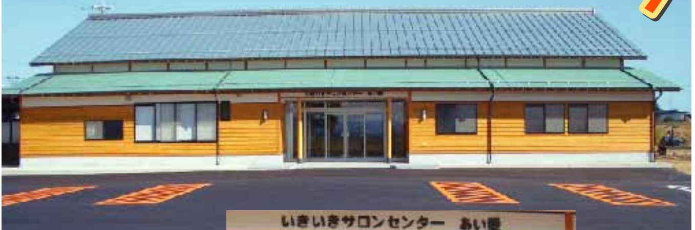
▲ いきいきサロンセンター あい愛 (坂井市三国町楽円)