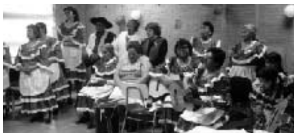
民族衣装「カンペシーナ」に身をつつんだ高齢者のみなさん