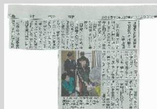
12/30 付 福井新聞記事