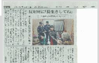
12/29 付 日刊県民福井記事