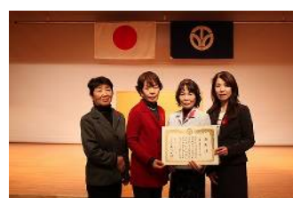
(三国女性ネットワーク)