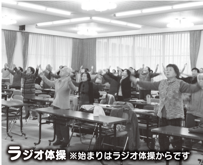
ラジオ体操 ※始まりはラジオ体操からです