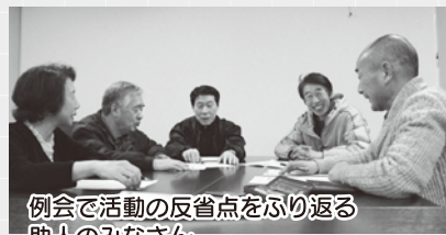
例会で活動の反省点を振り返る 助人のみなさん

の修繕など1〜2時間程度の簡単なお手伝いとし料金は無料です。(ただし、電球など消耗品等の費用は必要)