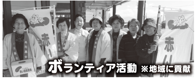
ボランティア活動 ※地域に貢献