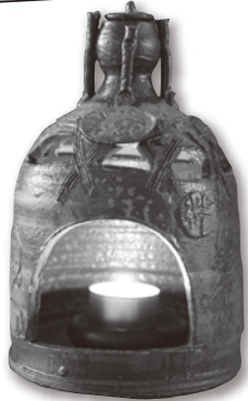
『3.11 希望の灯り』 3/11~3/17 市社協本部で点灯

市社協では昨年に引きつづき『3.11希望の灯り』を点灯し、市民の皆様とともに復興へ歩みつける被災地へ想いを馳せながら人と人のつながりや絆の大切さをわかち合いました。