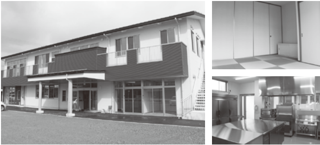
約200坪の施設(左)は、ゆとりスペース。利用者に応じて個別対応も可能な和室(右上)や「特製スマイルピッツア」を焼ける厨房(右下)も完備。

住所 坂井町大味30-21(えちぜん鉄道大関駅前) 問合せ 多機能型支援センターすまいる(72-7777)