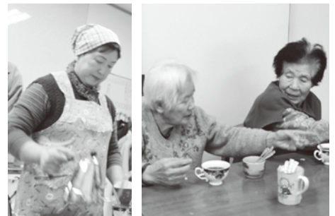
コーヒー講座で学んだお手前を市内施設で披露。利用者からも大好評でした。