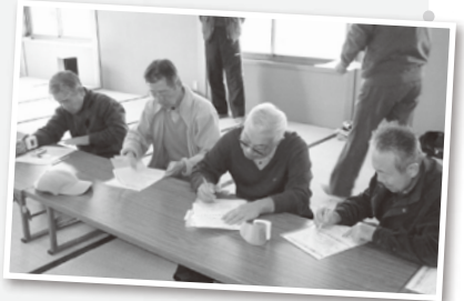
参加者自身が血圧測定し健康の自己管理