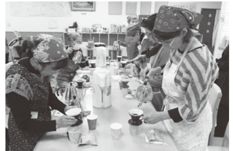
コーヒー講座では、みなさん真剣な表情でした。