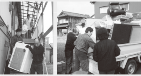
軽微なお手伝いは1人。引越は全員参加。

平成12年旧三国町で「何か高齢者の生活をお手伝いできないか？」とボランティアの有志が集まり、私たち『助け人』が誕生しました。会員は主婦をはじめ現役の大工や電気工事士などの「職人さん」で当初は約40名の会員が仕事をしながら趣味や資格を生かしたボランティア活動に取り組んできました。なかには80歳まで活動を続けていた人もいましたが、現在は5名の会員(50〜70代)で活動に励んでいます。(正田会長)