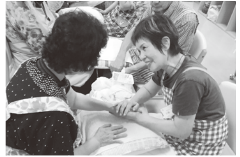
ビューティケア講座は『いやし』が求められる今、大人気の講座です。

個々の参加者がボランティアを通じてつながり合い、また新たなグループが生まれようとしています。